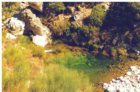
Garganta de Cuartos

En este descenso tendremos panorámicas de los puntos más altos de la Sierra como la Covacha (2399 m.), el Cancho (2271 m.), o los los Riscos Morenos, así como las gargantas (de derecha a izquierda) de las Meñas, y la Hoz. Al fondo, la Garganta de Cuartos.