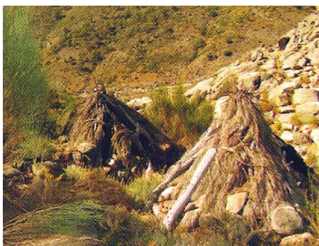
Chozos de Cabreros

Unos 100 metros antes de llegar al fin de la pista forestal hay una vereda antigua a la izquierda que tomaremos. Esta vereda nos llevará a lo largo de la Garganta, nos encontraremos con una majada (edificaciones de cabreros) a unos 300 metros, que dejaremos a la izquierda, continuando, a unos 600 metros cruzaremos la garganta de las Caballerías por un puente construido de madera. Subiendo, a unos 200 metros podremos observar un ejemplar de tejo, y seguidamente una zona muy verde y rebosante de agua, la Fuente de la Víbora.