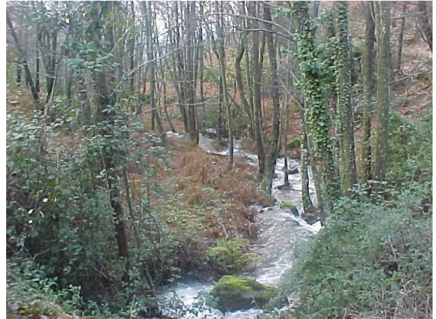
Arroyo de las Polilleras

Desde la presa subiendo a la izquierda campo a través unos 30 metros, hay una pista de tierra en mal estado, que se hizo para acceder a la garganta. La seguiremos a la izquierda hasta encontrarnos otra pista, que tomaremos a la derecha. Pasaremos por los arroyos Castañarillo, Quebraseca y Garranchal y llegaremos a otra toma de agua con una presa algo mayor que la anterior.